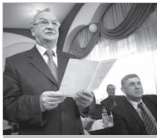
У общественников – много вопросов к «Росатому»