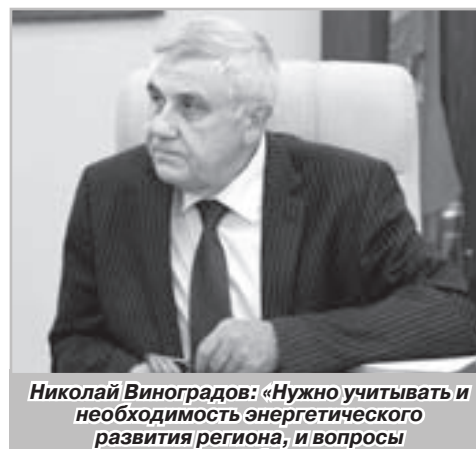
Николай Виноградов: «Нужно учитывать и необходимость энергетического развития региона, и вопросы экологической безопасности»